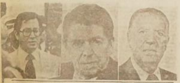
A les exploindares del monde les bless presimpades la preciente luche de les prebles, con an foder les rimmens del arbe combains in miserie y le spresile y en formante en en gent libertarie.